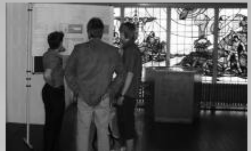
Pläne werden konkret: Umbau in Tonnenheide