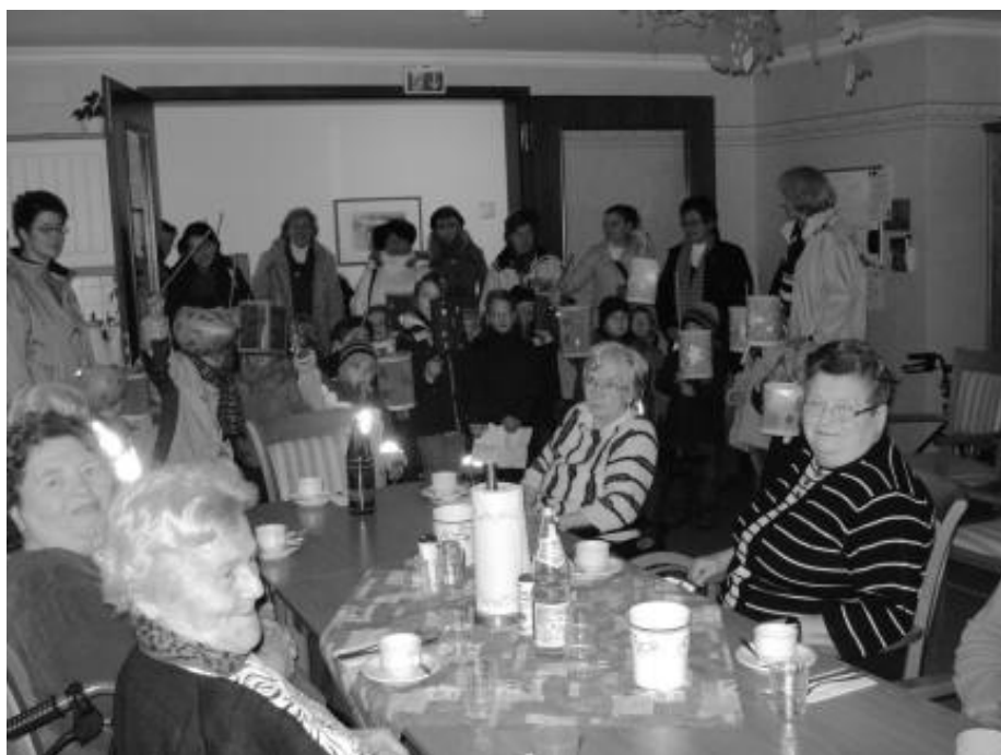
Alt und Jung singen Laternen-Lieder: Der Kindergarten Sonnenstrahl zu Besuch im Pflege- und Betreuungszentrum St. Johannes.

mit einem Sankt Martin Gottesdienst in der St. Johannes Kirche zu Rahden.