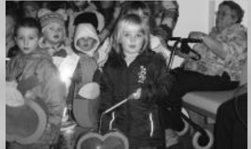
Laternenfest in den Ev. Kindergärten Rahden