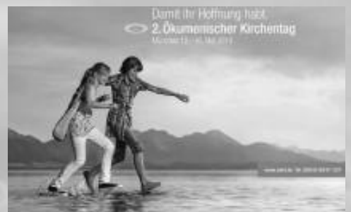
Fahrt zum Ökum. Kirchentag in München 2010