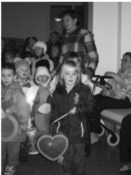
Alle Generationen singen mit, wenn die Laternen leuchten.

Anschließend zogen die Kinder mit ihren Familien, die musikalisch vom Spielmannszug Varlheide begleitet wurden, zum Seniorenheim am Eibenweg. Dort erfreuten sie die Bewohner mit Laternenliedern. Danach führte der Weg zurück zum Kindergarten, wo in gemütlicher Atmosphäre, bei warmen Getränken und einem Buffet mit Hot Dog das Fest ausklang.