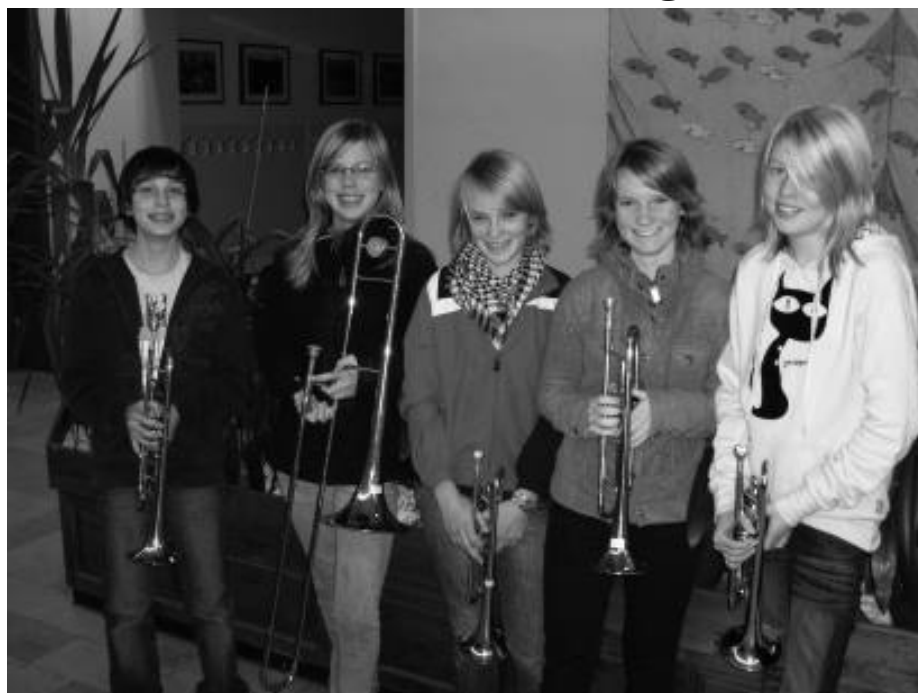
Ob Trompete, Posaune, Horn oder Tuba: für alle ist was dabei!

Im Februar 2010 beginnt ein neuer Anfängerkurs für Musikinteressierte. Wer mindestens 9 Jahre alt ist und ein Blechblasinstrument erlernen möchte ist herzlich willkommen. Der Posaunenchor stellt neben dem Instrument auch das erforderliche Notenmaterial zur Verfügung. Der Unterricht findet wöchentlich, immer dienstags außerhalb der Schulferien im Gemeindehaus Rahden, statt und ist mit einer Gebühr verbunden. Vorkenntnisse sind nicht erforderlich. Die Bereitschaft zum re-