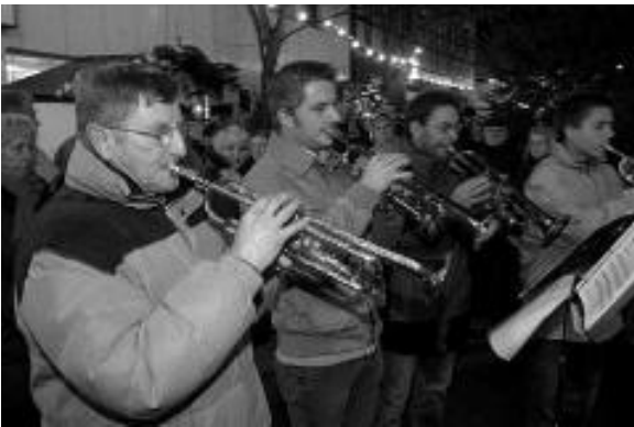
Trompeten eröffnen den Weihnachtsmarkt.

Der Dezembertraum vor Weihnachten - das ist schon Tradition in Rahden. Seit Jahren lockt der urige Weihnachtsmarkt in der idyllischen Atmosphäre rund um die St.-Johannis-Kirche viele Besucher aus Nah und Fern. So dürfen sich die Besucher auch in diesem Jahr auf ein tolles Programm freuen. Noch schöner, noch größer und noch länger heißt die Devise des Rahdener Weihnachtsmarktes, allseits auch als "Rahdens Dezemberträume" bekannt, in diesem Jahr.