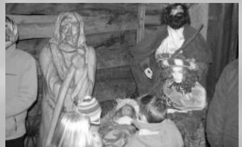
„Dezemberträume“ rund um die St. Johannis-Kirche