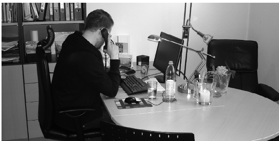
Bei der Telefonseelsorge hat immer jemand Zeit für ein Gespräch.

Weitere Informationen über die TelefonSeelsorge vor Ort , die in Trägerschaft der Kirchenkreise Minden, Lübbecke, Herford und Vlotho auch schon seit über 30 Jahren besteht - und Informationen zum Thema ehrenamtliche Mitarbeit - unter www.Telefonseelsorge-Ostwestfalen.de