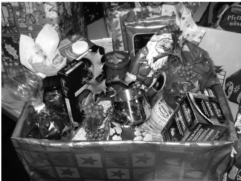
Eine liebevoll gepackte Weihnachtskiste macht Freude!

Seit mehr als sieben Jahren teilen wir - die Rahdener Tafel - jeden Donnerstag Lebensmittel aus, die in den Geschäften nicht mehr verkauft werden können. Die Lebensmittel werden von ehrenamtlichen Fahrern in die Espelkämper Sortierhalle gefahren, um dort täglich für eine der sechs Ausgabestellen sortiert, zusammengestellt und ausgeliefert zu werden.