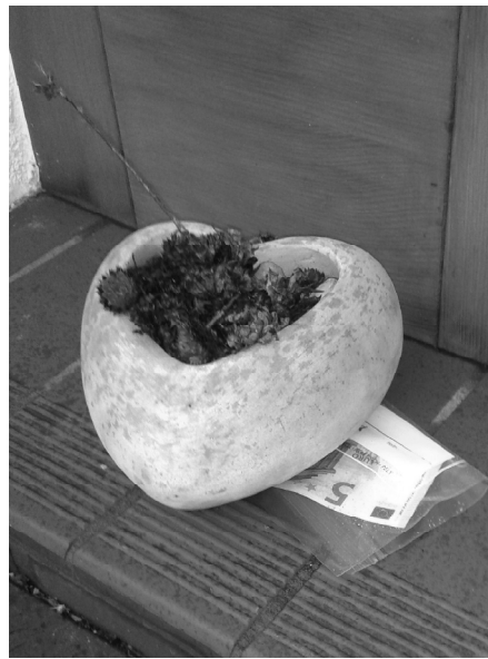
Das Herz mit dem Geldschein!

„Hallo, Tannenbaumabholer! Tannenbaum liegt hinterm Haus auf der Terrasse. Spende liegt unter der herzförmigen Schale hier unten links! MfG ...“ - Und wirklich: Links neben der Haustür liegt ein Herz, unter dem ein Fünfeuroschein hervorschaut. Hier hat sich jemand Gedanken gemacht, wie er mit gutem Gewissen dafür sorgen kann, dass sein ausgedienter Weihnachtsbaum ordnungsgemäß entsorgt wird. Denn jedes Jahr am ersten Samstag nach Epiphania (nach dem 6. Januar oder auch Dreikönigstag) sammeln viele ehrenamtliche Mitarbeitende vom CVJM-Rahden die Bäume ein. In der Regel wird an jeder Haus- oder Wohnungstür geklingelt und um eine Spende gebeten. Und da es für einen guten Zweck ist, geben viele auch gerne und reichlich. Aber auch kleine Summen sind willkommen: „In diesem Jahr haben wir keinen Baum, aber eine Kleinigkeit geben wir gerne!“ Mit einem Teil des Geldes wird das Partnerschaftsprojekt des CVJM-Rahden in Sierra Leone gefördert. Nach der Ebola Epidemie 2014 bis 2015 wird noch jeder Euro in diesem armen Land dringend gebraucht. Mit dem andern Teil des Geldes wird die Jugendarbeit des CVJM-Rahden finanziert. Wie viele Tannenbäume jedes Jahr in Rahden zusammenkommen, hat noch niemand gezählt. Aber am Ende der Weihnachtsbaumaktion, wenn alle Bäume eingesammelt sind und alle Mitarbeitenden wieder im Jugendkeller sind, steigt die Spannung: