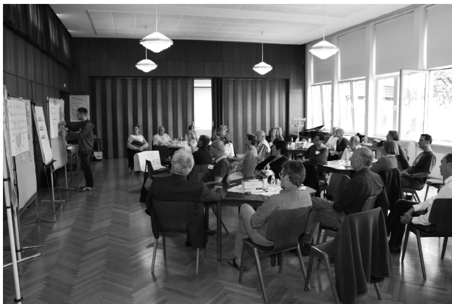
Gemeindekonferenz: Ergebnisse werden zusammengetragen.

zwei Gottesdienste pro Außenbezirk einen besonderen musikalischen Akzent haben.