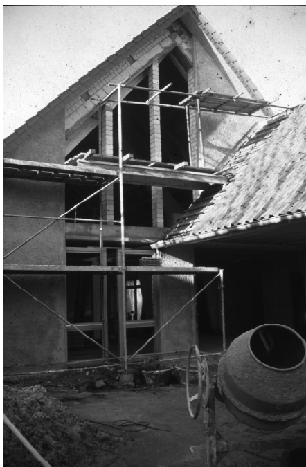
Erinnerung an die Bauphase des Paul-Gerhardt-Hauses 1991

das seinesgleichen sucht. Denn in gutem nachbarschaftlichem Miteinander bilden seitdem Paul-Gerhardt-Haus und Dorfgemeinschaftshaus zusammen mit den nebenliegenden Sportanlagen den Ortskern der Altgemeinde, den es so vorher nicht gegeben hatte.