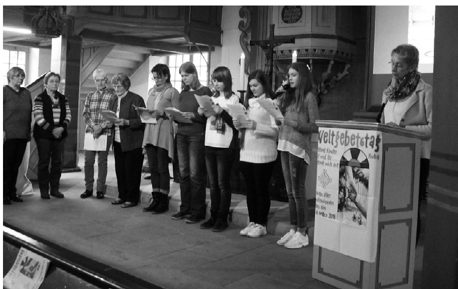
Frauen aus allen Bezirken beteiligen sich am Weltgebetstag.

Die Frage nach der Gerechtigkeit steht im Mittelpunkt, wenn am Freitag, dem 3. März 2017, philippinische Christinnen zum Weltgebetstag einladen. Ins Zentrum ihrer Gottesdienstordnung haben die Frauen aus dem bevölkerungsreichsten christlichen Land Asiens das Gleichnis von den Arbeitern im Weinberg (Matth 20, 1-16) gestellt. Den ungerechten nationalen und globalen Strukturen setzen sie die Gerechtigkeit Gottes entgegen. Der Weltgebetstag der philippinischen