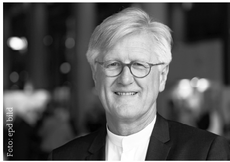
Landesbischof Dr. Heinrich Bedford-Strohm, Vorsitzender des Rates der Evangelischen Kirche in Deutschland (EKD)

Dr. Heinrich Bedford-Strohm zur Jahreslosung 2017