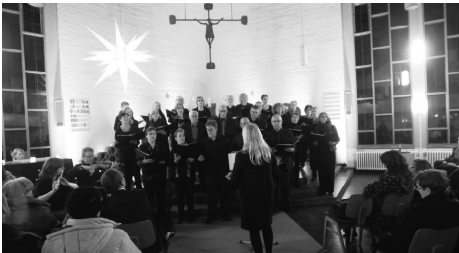
Stimmungsvolle Gesänge zur Adventszeit: WeTo beim Adventskonzert