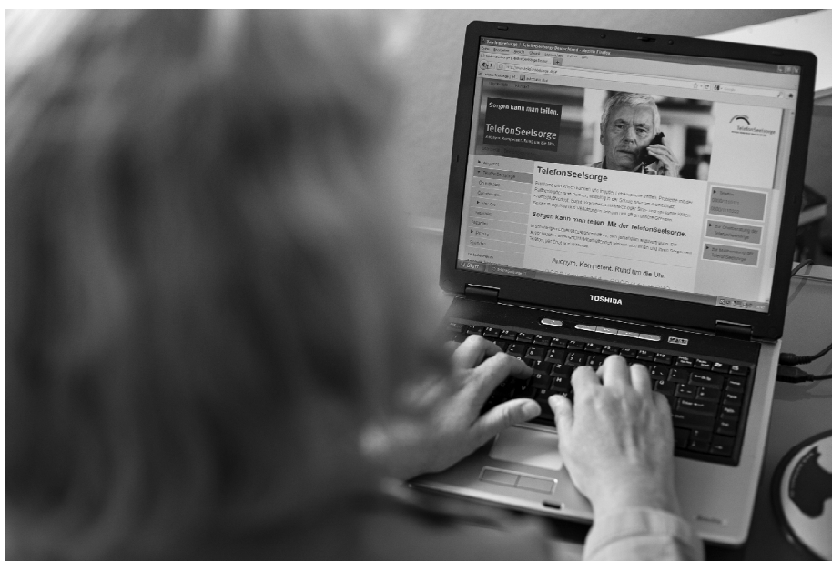
Seelsorge im Chat: die Anonymität des Internets bietet Schutz.

Ehrenamtliche Telefonseelsorgerinnen und Telefonseelsorger sind nicht nur telefonisch rund um die Uhr zu sprechen, sondern engagieren sich im Internet: schnell, niederschwellig, kostenfrei. Chatberatung und Mailseelsorge sind so gesichert, dass kein Unbefugter mitlesen kann. Ratsuchende sind dankbar für diesen ge-