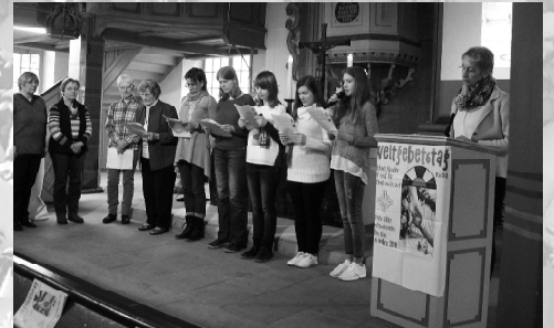
Weltgebetstag 2017: Philippinen laden uns ein