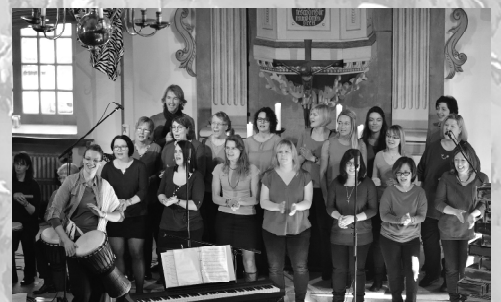
Chorprojekt war erfolgreich: Gospelchor startet durch